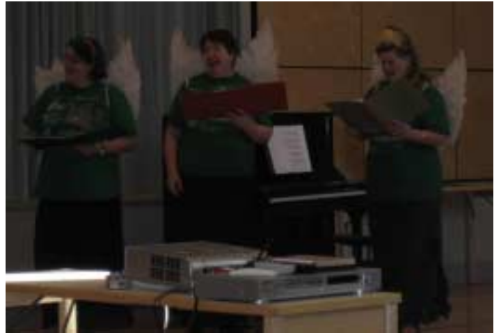
Taistelevat Mehtot esiintyivät juhlassa

Tästä kehittyi myös yhteistyö muiden itä-helsinkiläisten kau-