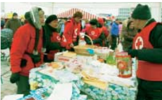
Jokaiselle löytyy tekemistä – kaikkia tarvitaan

Osa vapaaehtoisista toimii henkilökohtaisina ystävinä, osa on mukana yhteisissä tapahtumissa. Vanhuksen ystävä on juttukaveri tai lenkkiseura, yhdessä voidaan harrastaa kulttuuria tai käydä asioilla. Vapaaeh-