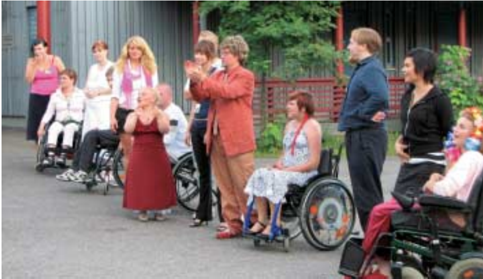
Kontaktileirille HerziCamp'07 osallistui 46 nuorta

Olet jo ehkä tavannutkin meitä Nälkäpäiväkeräysten yhteydessä tai leikkipuistojen kevättapahtumissa. Ystävätoiminta on osastomme keskeisin toimintamuoto, lisäksi meillä on nuorten tukihenkilötoimintaa ja kontaktitoimintaa eli vammaisten ja vammattomien nuorten yhteistoimintaa. Toteutamme Punaisen Ristin valtakunnallisia keräyksiä, joista seuraava, Nälkäpäivä, järjestetään 20.-22.9.2007. Kerääjäksi voi ilmoittautua soittamalla Korttelitupaan, joka on osastomme ”päämaja”. Siellä tarjoamme ympäristön vanhuksille juttuseuraa ja kahvit tiistaisin 11-14 ja torstaisin 12-15, siellä myös askarrellaan ja kokoustetaan. Kerran kuussa vietämme ”Leppoisan lauantain”, ohjelmallisen kahvitilaisuuden Kettukerholla. Lisäksi järjestämme virkistystilaisuuksia Herttoniemen sairaalan potilaille ja Kettutien palvelutalon asukkaille.