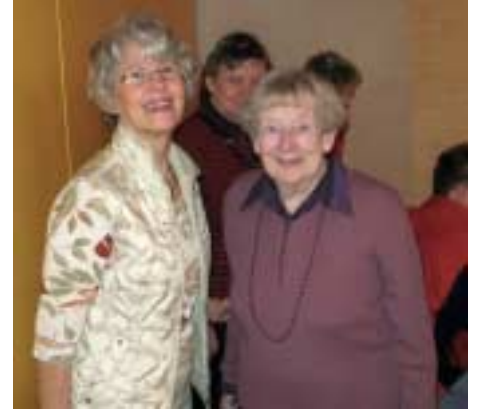
Ystävätoiminta on yhdessä vietettyjä hetkiä, se on palkitsevaa.

toinen voi toimia myös kahvinkeittäjänä, seurana virkistystilaisuuksissa tai vaikkapa käynnistää alueen valmiustoimintaa. Vapaaehtoistoiminnan peruskurssi perehdyttää Punaisen Ristin periaatteisiin ja antaa valmiudet toimia ystävänä. Ystävätoimintaan voi tuoda omaa osaamista ja saada uusia ideoita muilta osallistujilta. Ikä ei ole este- toiminta sopii kaikille! Iloitsemme myös kannatusjäsenistä!