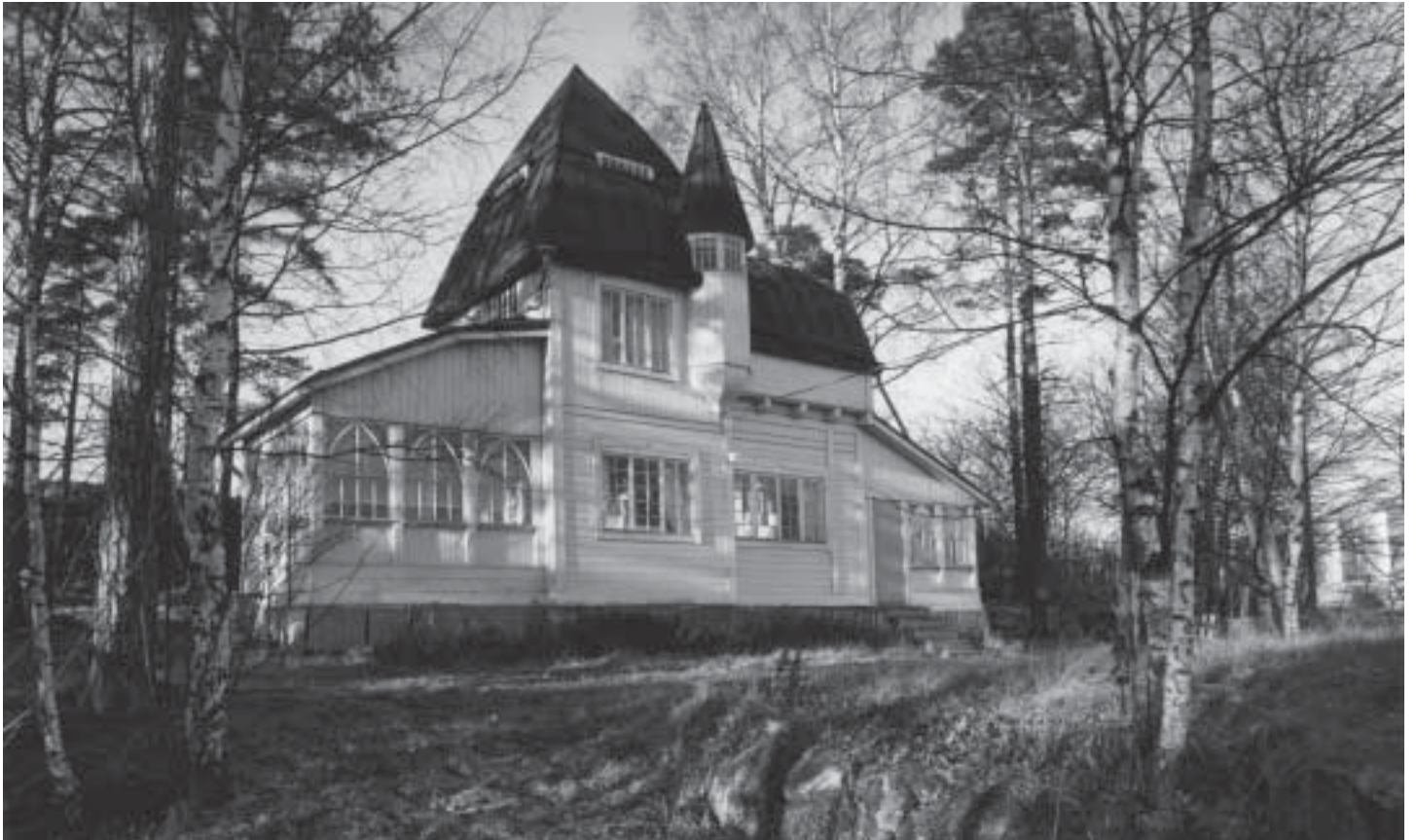
Herttoniemenrannan Kipparivuorella sijainnut rikasmuotoinen puuhuvila paloi vuonna 1998.

1800-luvun alkupuolella sanomalehdet olivat yleensä nelisivuisia. Kerran tai kaksi viikossa ilmestyneistä lehdistä voitiin lukea pieniä artikkeleita ja kaunokirjallisia tuotteita, mutta mukaan mahtui myös erilaisia julistuksia, kuulutuksia ja pikku-uutisia.