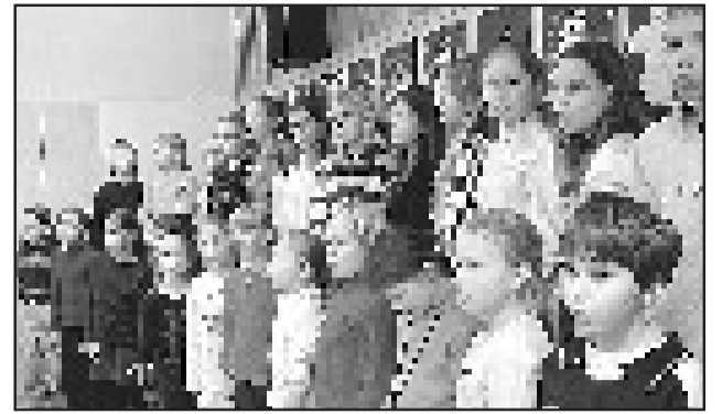
Kolmannen vuosiluokan musiikkiluokka harjoittelee Herra Huu-biisiä maaliskuista kevätkonserttia varten.

Oppilaat voivat tuoda lahjoituksia myös koulupäivän aikana.