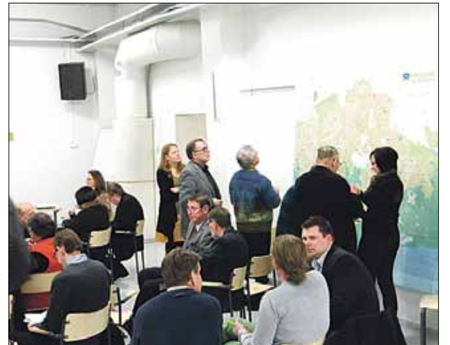
Pohjoisten kaupunginosien aktiiveja työskentelemässä Helka ry:n yleiskaavaseminaarissa Stadionilla.

Lisätietoja www.yleiskaava.fi www.kaupunginosat.net/ruohonkarjet