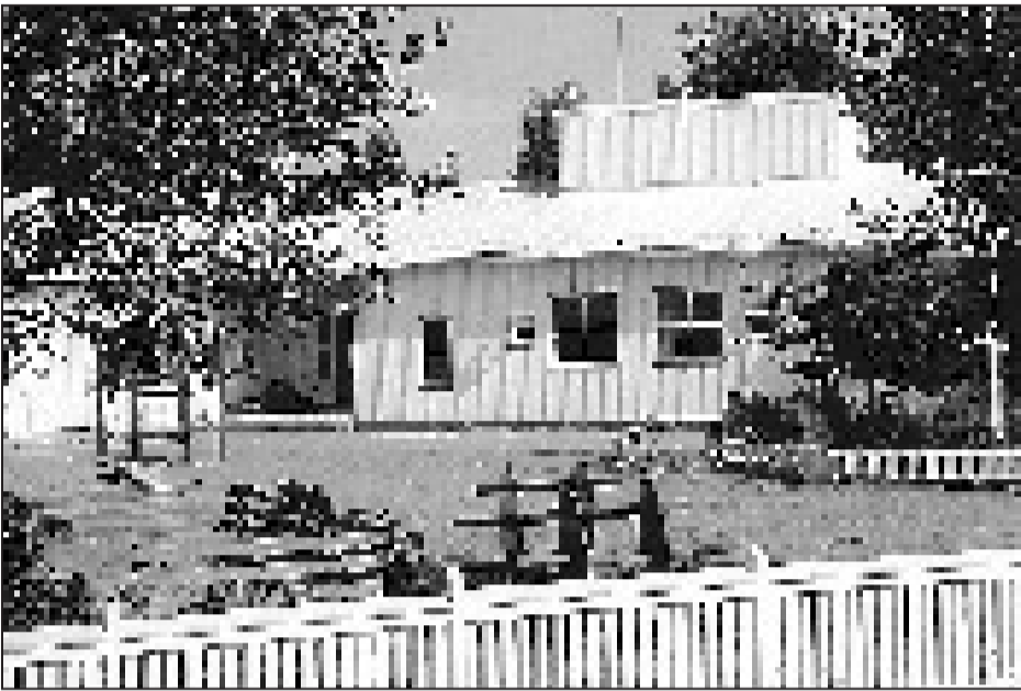
Torpparinmäen perhekeskus sijaitsee lapsiystävällisissä tiloissa omakotiasutuksen keskellä.

Torpparinmäessä, Näsiinjankuja 2, on aloittanut perhekeskus, alueen pikkulapsiperheille ja heidän läheisilleen tarkoitettu kohtaamis-, toiminta- ja informaatiopaikka. Järjestyksessä Helsingin kaupungin toinen perhekeskus sijaitsee viihtyisän omakotiasutuksen keskellä entisessä päiväkodissa, jossa on lapsikeskeiselle toiminnalle ihanteelliset tilat. Perhekeskus kuuluu pohjoisen sosiaalikeskuksen Maunulan sosiaalipalvelutoimistoon.