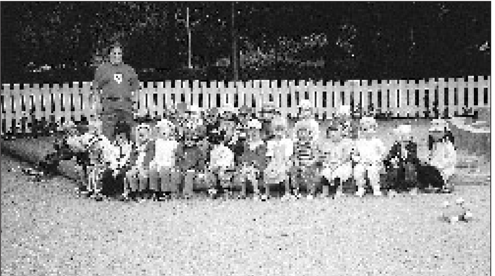
Riitan puiston tarhalaiset kevään yhteiskuvassa.