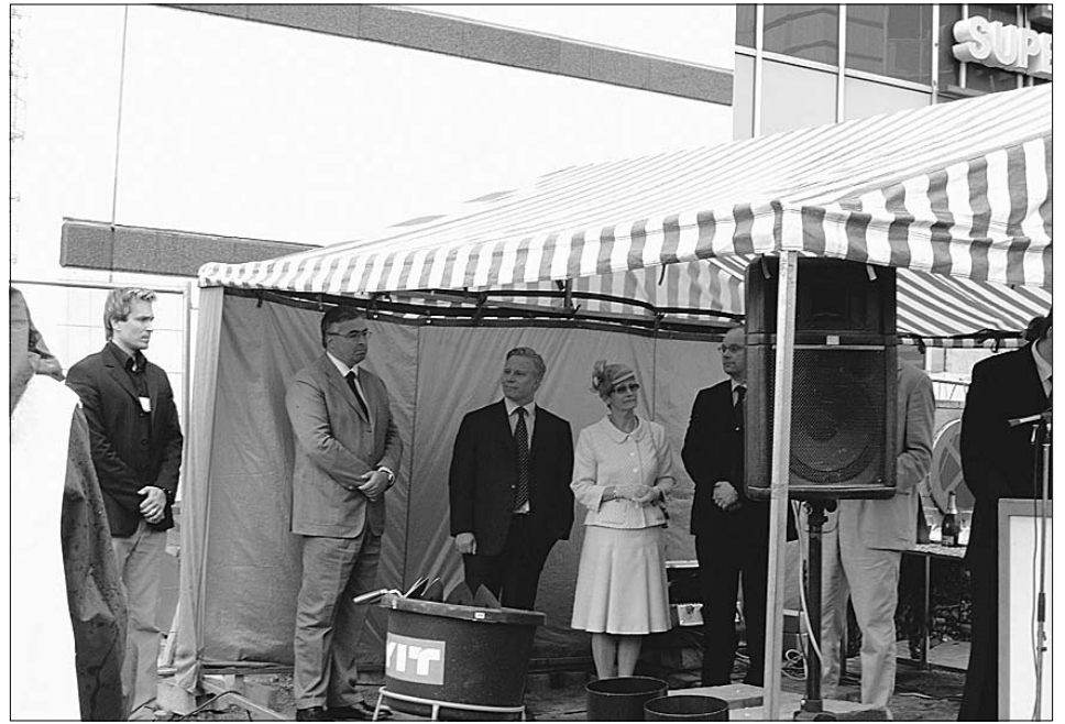
Oulunkylässä Panuntien Käpylän aseman lähellä sijaitsevan YIT:n pääkonttorin laajennushankkeen peruskivi muurattiin juhannuksen alla.