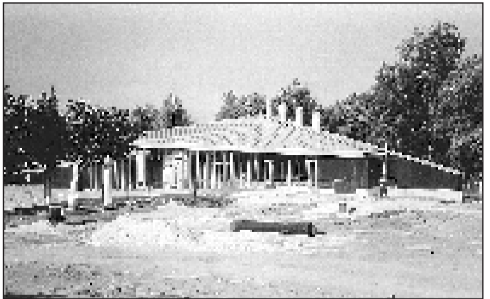
Etupellon asukaspuisto valmistuu ensi vuoden elokuussa, siihen liittyvä asukastalo on jo ahkerassa käytössä.