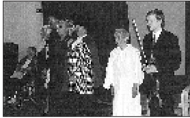
Helander-kodin 20-vuotisjuhlassa syyskuussa asukkaiden ja henkilökunnan pienoisnäytelmä "Kreivittären kynneleet" kutsutti yleisön nauruhermoja.

Maunulan Helander-koti juhlii tänä vuonna 20-vuotista toimintaansa. Suursuontielle sijaitseva 67-paikkainen palvelutalo on suurin Ilmari Helanderin Vanhusten Säätiön kolmesta Helander-kodista. Se sijaitsee Suursuon sairaalan, terveysaseman ja pohjoisen sosiaalikeskuksen vieressä.