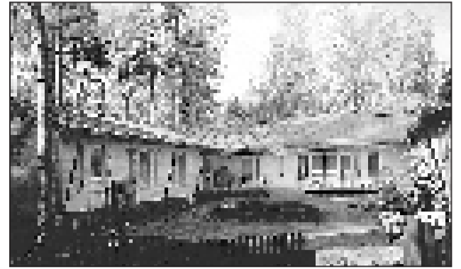
Kustaankartanon alueen Tuusulantien puoleiselle reunalle valmistui uusi rakennus. Sisään päästiin muuttamaan lokakuun alussa.

Rakennusten ulkopinnoitteen ruskea vaakalaudoitus sopeutuu hyvin Kustaankartanon tiilenpunaiseen ympäristöön, eivätkä loivat peltikatot juuri näy.