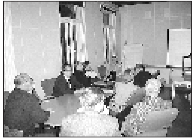
"Ukkoin puoli"... Kun alueen palveluja koskeva päätöksenteko loittonee Helsingin ydinkeskustaan, alueellisten intressien ajamiseksi tarvitaan entistä aktiivisempaa yhteistoimintaa, kaupunginosayhdistystemme edustajat pohtivat.

Komitea jatkaa työtään. Koko Helsingin organisaatio pannaan uusiksi. Syyskuun puolivälissä komitea ehdotti opetustoimen oppilasryhmäkokojen optimoimista. Koulutus ja kehittämisskeskuksen koulutus- ja konsultointipalveluja esitettiin maksullisiksi ja yksiköstä pitäisi tehdä tulosyksikkö. Kaupungin taloushallinto kokee mullistuksia. Mitä lie vielä tulos-