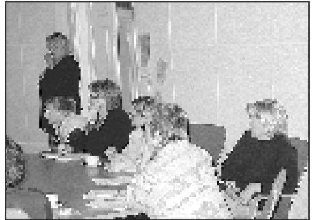
"Akkain puoli"... Vaikka hallinto keskitetäänkin Kallion virastotaloon, alueen asukkaat eivät välttämättä edes huomaa tätä muutosta, kun palvelut säilyvät alueella.