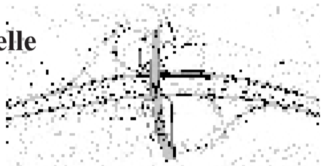
Tuusulantielle ja Käslynhaltijantielle tulee uudet Jokeri-pysäkit

Sillan leveyttä joudutaan hieman lisäämään jalkakäytävien ja pysäkkien osalta. Maunulan puolella moottoritien lisärakentaminen jää vähäiseksi, kun jo putkisiirron aikana tehdyt levennykset käytetään hyväksi. Oulunkylän puolella nykyinen