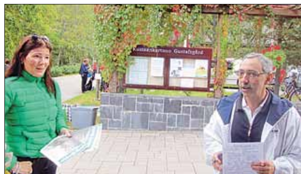
Oulunkyläläiset keskustelivat Kyläjuhliilla vilkkaasti kansanedustajien Sari Sarkomaan ja Ben Zyskoviczin kanssa.