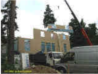
klikkaamalla tarkempi kuva

UUSIMMAT UUTISET | TOUKOKUU 2002 | HUHTIKUU2002 | MAALISKUU 2002 | HELMIKUU 2002